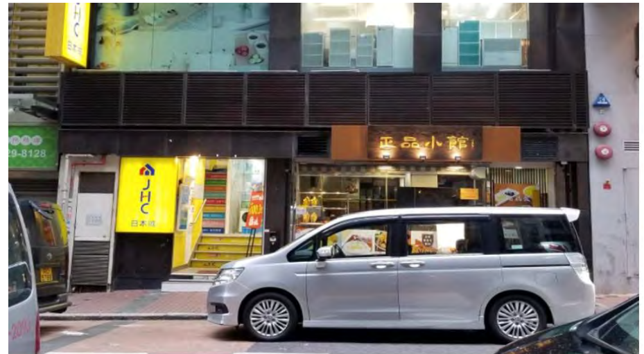
佐敦庇利金街42號金陵大廈地舖蝕讓放盤

據土地註冊處資料，業主於2013年以8,500萬元購入上址，即最新叫價較買入價低500萬元，蝕約5.8%求售。