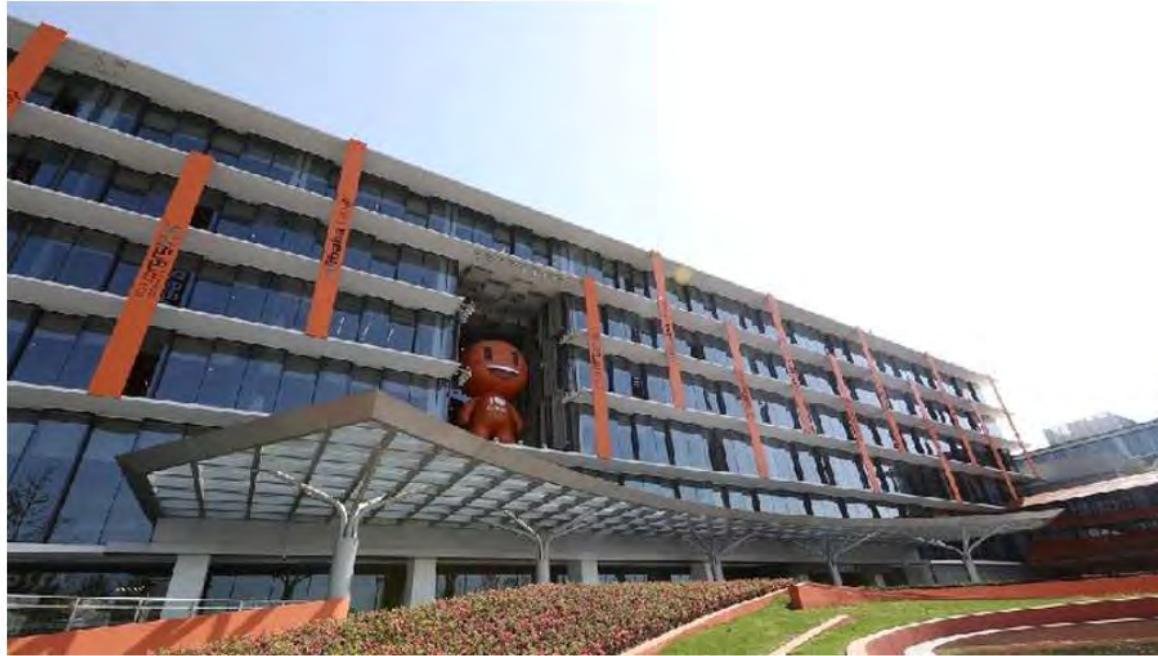
阿里：淘寶8月交易額創一年最快增速。